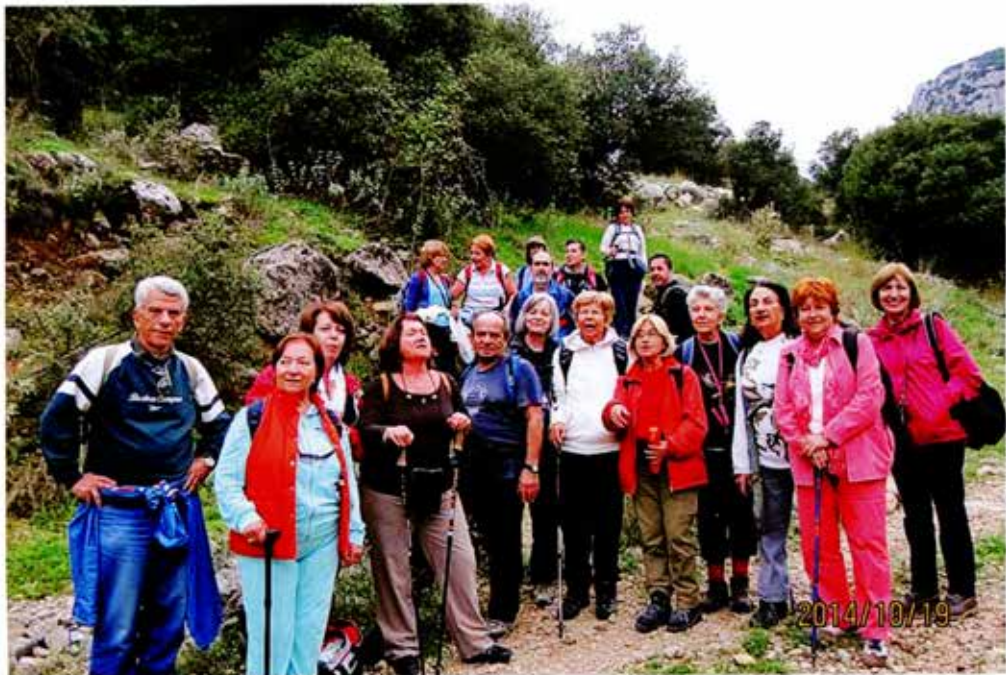
Αμφίκλεια - Αγ. Ιερουσαλήμ.