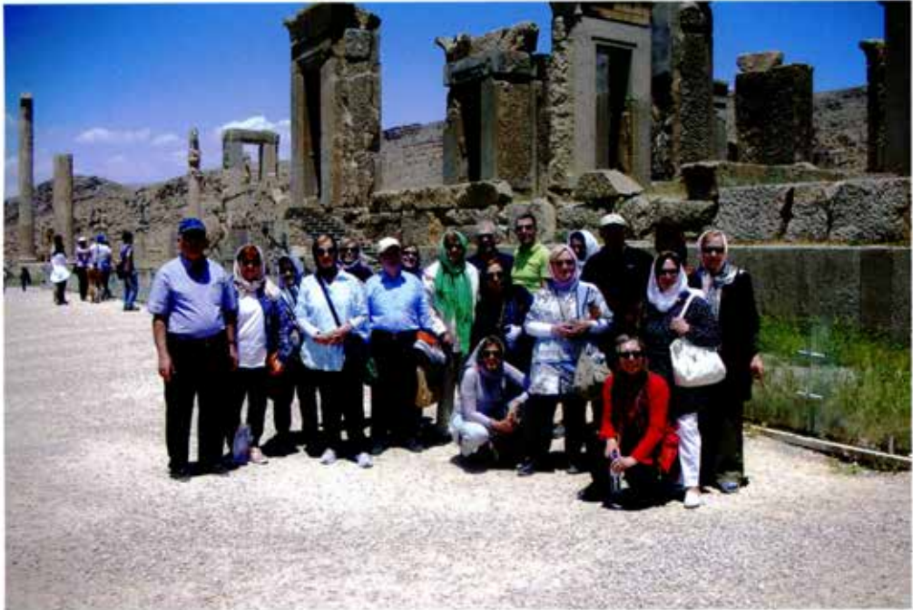
Ομάδα του Αττικού στην Περσία