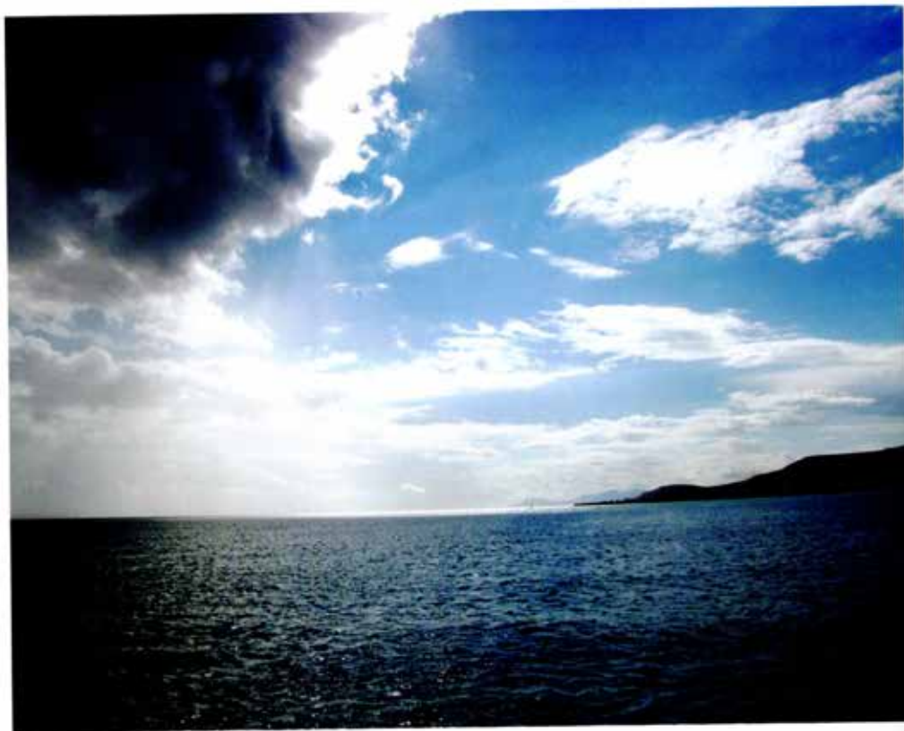
Νεάπολη – Ακρωτήρι Μαλέα.

Την τρίτη ημέρα της εκδρομής μας περίμενε μια έκπληξη. Η επίσκεψη στο σπήλαιο της Καστανιάς του Δήμου Βοιών