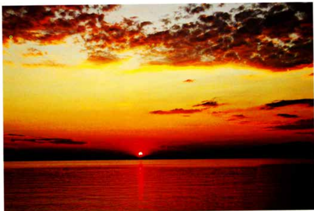
ΗΛΙΟΒΑΣΙΛΕΜΑ ΣΤΗ ΘΑΣΟ.