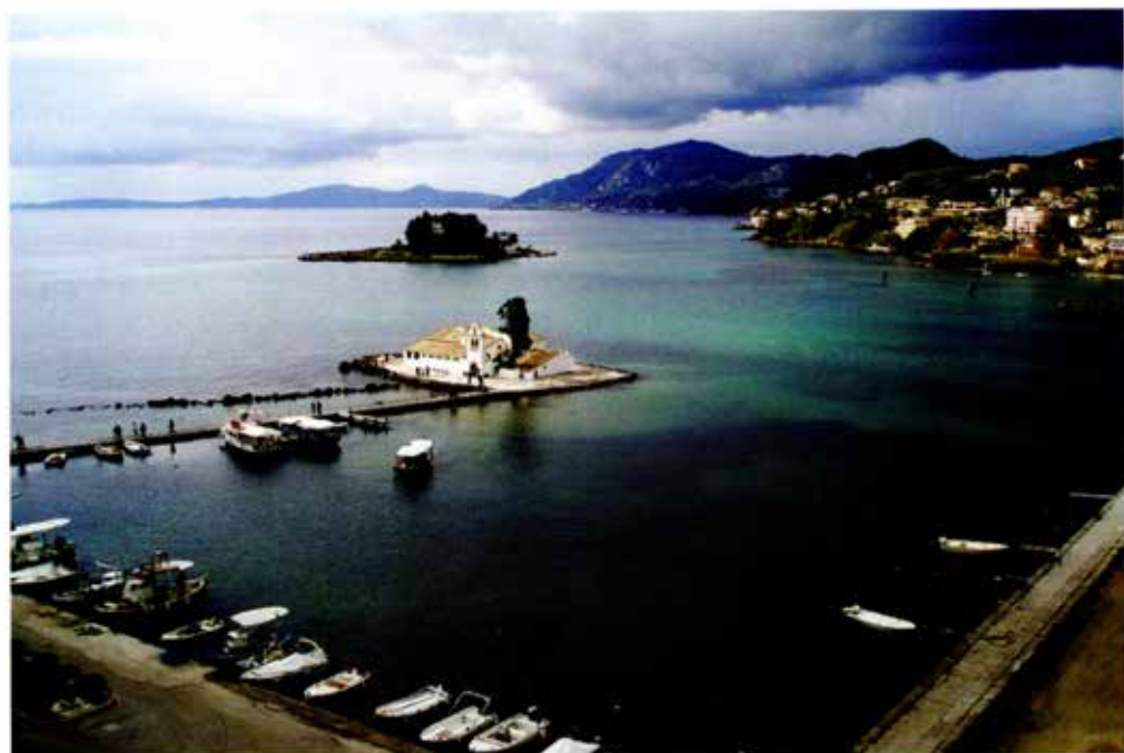
Πάσχα στην Κέρκυρα.