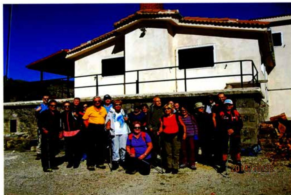
Καταφύγιο Μαινάλου.